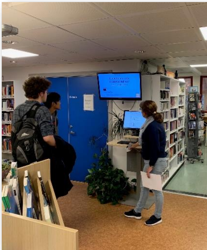
Ukens grubleoppgave bryter isen, skaper engasjementer og bidrar til det psykososiale miljøet. (Fra Røyken VGS. – Viken )

Trygt: Vi bruker kun anerkjente kilder på oppslagene og kjøper lisens på bilder der det er nødvendig.